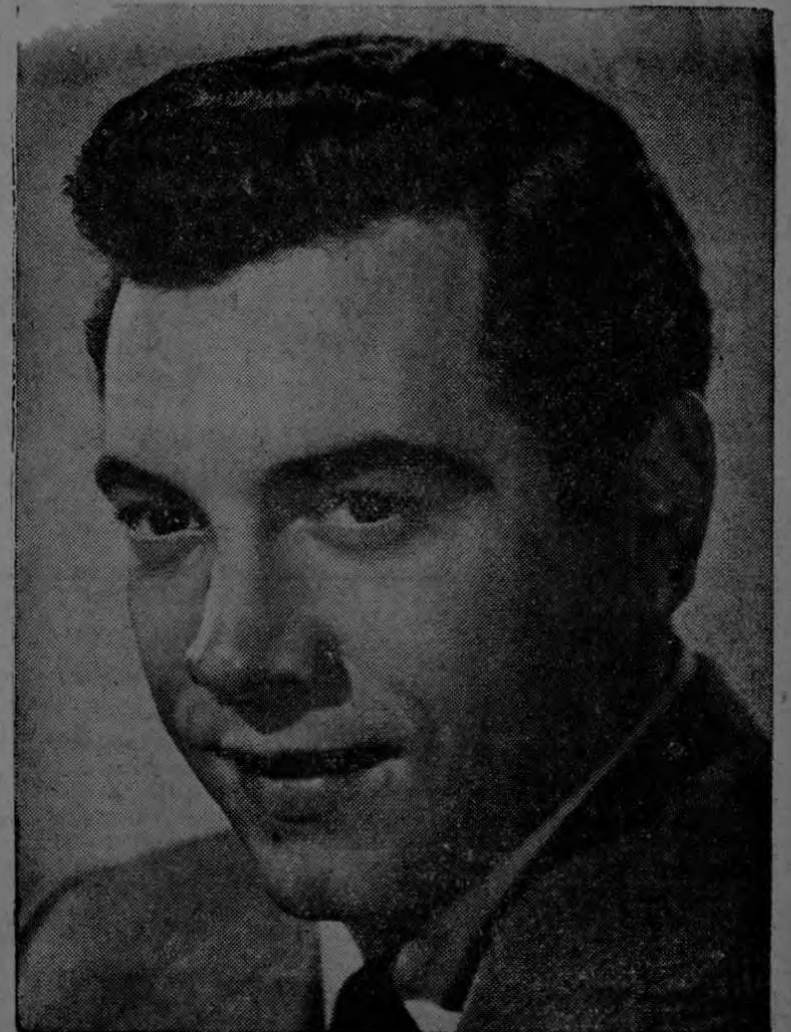
MARIO LANZA — Nuevo astro de la METRO GOLDWYN MAYER

El tópico actual de las conversaciones en Hollywood es — Mario Lanza, brillante joven tenor cuya voz se compara con la del inmortal Caruso.